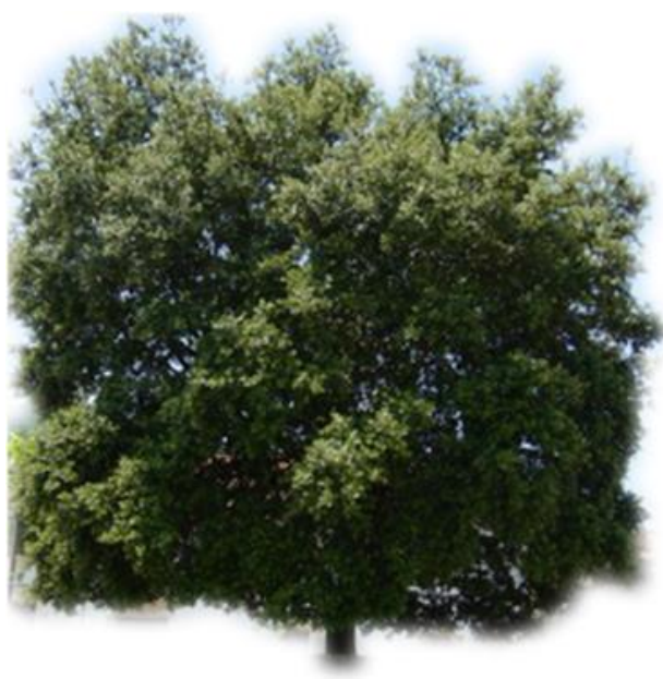
Zerainen, 2019ko martxoaren 24an.

Gure proposamena horretarako da. Hemendik aurrera, gurea adina da zurea ere. Denontzat daukagu lekua Zeraingo artepe eder honetan!