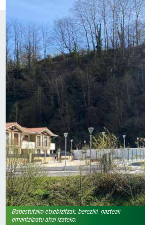
Babestutako etxebizitzak, bereziki, gazteak emantzipatu ahal izateko.

Herriko ondarea da herriko nortasuna eta herria egiten gaituena eta honenbestez, uste dugu, zeharo utzita eta egoera kaxkarrean dagoen Oriarko Jauregiari irtenbidea emateko udalak jarrera aktiboa jorratu behar duela eta bide batez, inguruko eremu berdea herrirako berreskuratu.