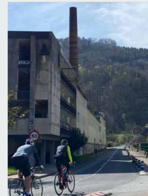
Paper fabrikako bulegoak berreskuratu, ekipamenduak jarri ahal izateko.

Paper fabrikako eremua berreskuratu behar dugu eta industriaguneaz gain, bi erronka ditugu konpontzeaz, paper fabrikako bulego eraikinaren berreskurapena, bertan hainbat ekipamendu kokatzeko eta, bestetik, trafikoaren sargune egokiak antolatzea.