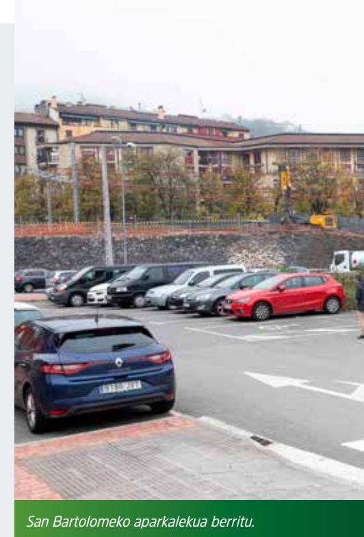
San Bartolomeko aparkalekua berriro.

Majori Kiroldegiko obren bigarren fasea garatu eta martxan jarri, igerilekuko instalazioak berriro ahal izateko, beti ere herriko kirol talde eta elkarten lana bultzatuz.