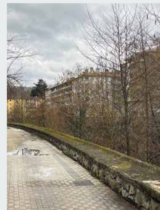
Ordizia txukun eta garbiago bat.

Trenbidea N-I aldera mugitzeko proiektuari berrekin, Ordiziak etorkizunera begira duen desafio urbanistiko nagusia gauzatu dadin. Herritarrentzat eta herri ekipamenduetarako espazio bat irabaziko luke herriak.