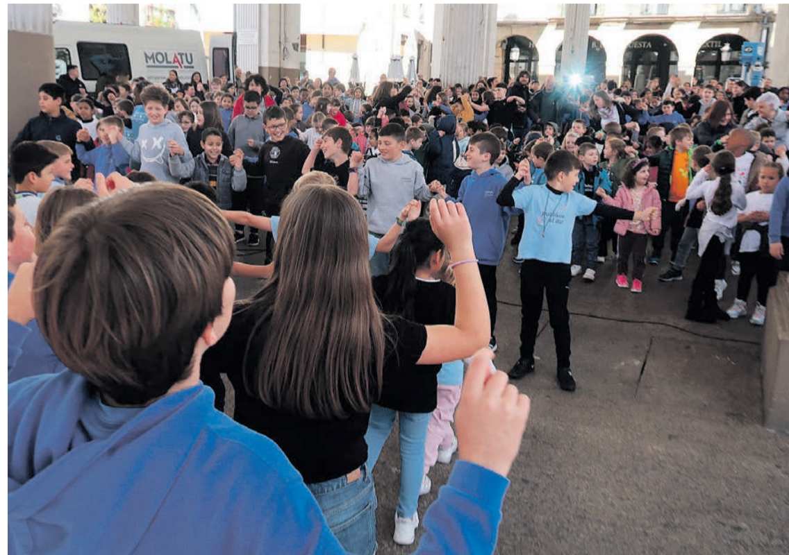
Euskal Eskola Publikoaren 31. Jaiko abestiaren aurkezpena, Ordiziako Plaza Nagusian, maiatzean. L.G.

Abenduan aurkeztu zuten Euskal Eskola Publikoaren 31. Jaia. Publikoa al do leloa auke- ratu dute, Goierriko euskalkiari erreferentzia eginda. Publiko- tasuna txoko guztietara eraman nahi dute, aniztasuna modu po- sitiboan zabaldu, euskalduntzea bultzatu eta hezkuntza sistema publikoaren garrantzia azpima- rratzeko. Ordiziako Euskal Eskola Publikoko komunitateko kideek nabarmendu bezala, komunita- tea osatzen duten milaka lagun- en topaleku izatearekin batera, egun aproposa izango da igandea eskola publikoaren ezaugarriak gizarteratzeko: «Publikoa den neurrian denona eta denontzat da, euskararen eta euskal kultu- raren sustatzailea, herrian txer-