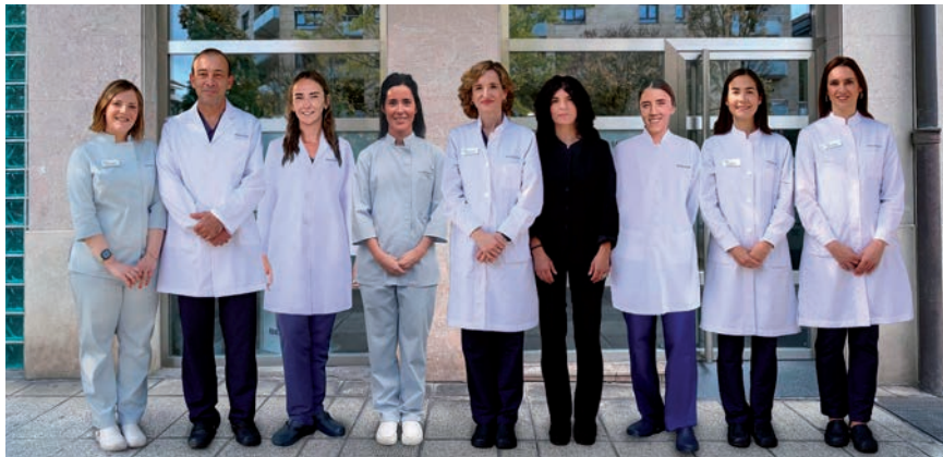
Beasaingo Begitek zentroko lantaldea / BEGITEK

Sei mediku oftalmologo eta bi optiko-optometrista froga eta azterketak egiteko izaten gara Beasainen kontsultan. Administratzaile arduradunak kudeatzen ditu txandak. Oftalmologiako azterketa oinarritzakoaz gain, azken urteetan hainbat diagnostikorako gailuekin osatzen joan gara zentroa. Helburua bertan diagnostiko zehatz baterako frogara osagarriak egitea da, eta Donostiara ebakuntza edo tratamendu espezi-fiko batzuetarako bakarrik joatea. Kli-