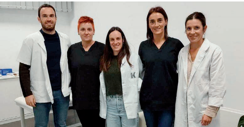
Arlo desberdinetako profesionalak lan egiten dute Kalakan. Lide Egizala