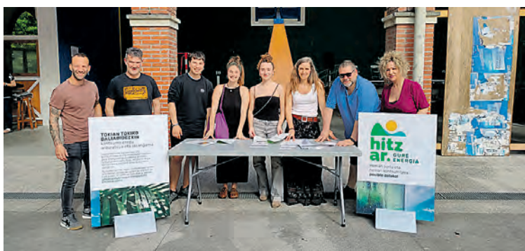
Itsasondoko Hitzar energia komunitatea. LOINAZ AGIRRE

● Legazpin, Zerainen, Urretxun eta Itsasondon abiatu dituzte 2024an.