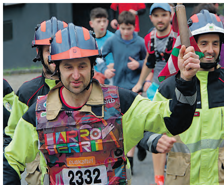
Goierriko suhiltzaileak ere korrika euskararen alde. KORRIKA