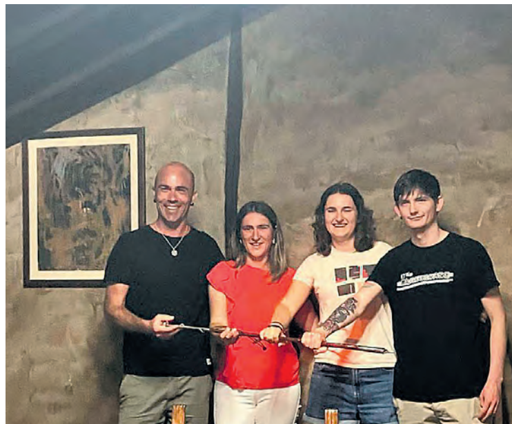
Zeraingo Udalaren eraketa 2023ko ekainean. ZERAINGO UDALA

Urteagaren aurreneko aldia zen politikagintzan. Aurretik herrigintzan maiz aritua zen arren, 2023ko ekainean hartu zuen alkate kargua, EH Bilduk maiatzeko hauteskundeak aldeko 112 bozkarerekin irabazi eta Zerain Burujabe herri plataformari aurrea hartu