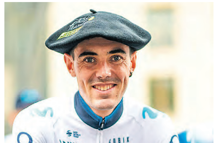
Alex Aranburu txirrindulari ezkiotarra.

Horren ondoren, gainera, abuztuaren 20an, Movistar Team taldea utzi eta Frantziako Cofidis taldearekin fitxatu zuen hurrengo hiru denboraldietarako. ●IV