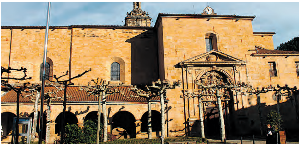
Zegamako San Martin eliza. ARKAITZ APALATEGI