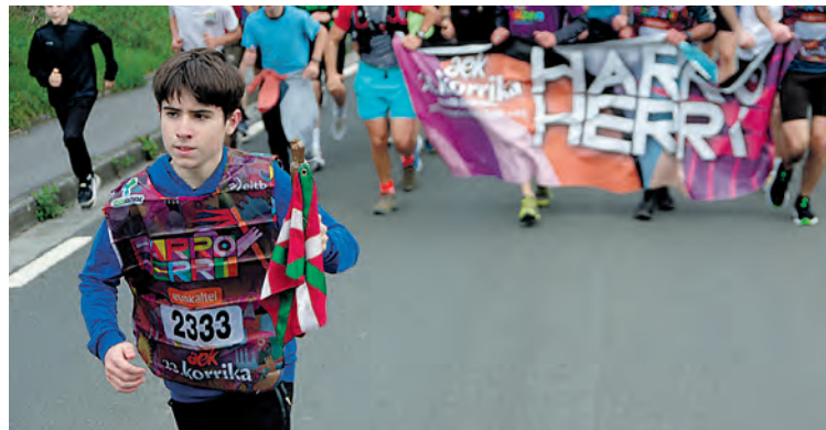
Gazte bat lekukoa eramaten Olaberrian. KORRIKA