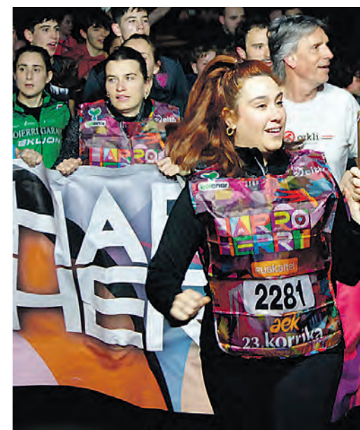
Urretxu-Zumarragan, gauzez. KORRIKA