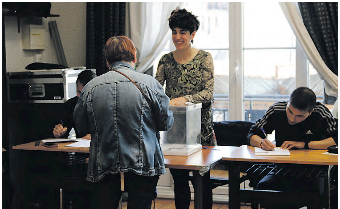
Emakume bat bozkatzeko Goierrin, Eusko Legebiltzarrerako hauteskundeetan, apirilaren 21ean.

→ Urretxuko Aizpuruena liburutegiko hauteslekua A21ean.