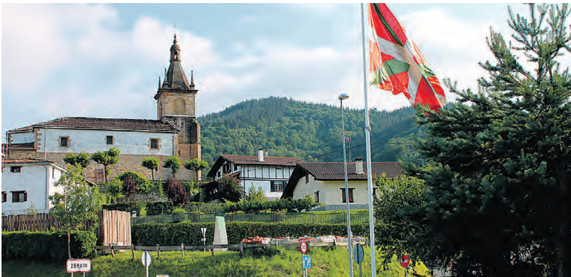
Zeraingo herrigunea. ARKAITZ APALATEGI