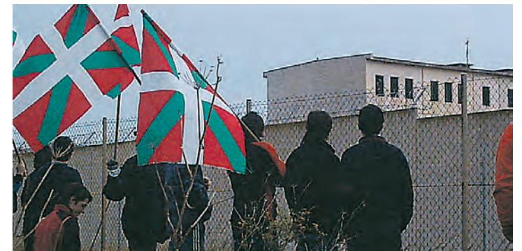
Zaldibiarrek Castelloko espetxean, Jauregiri bisitan.

Esnaola, berriz, Ocaña I kartzelatik Soriara lekualdatu zuten 2020ko urrian, zigorraren erdia bete zuela. 2021eko apirilean Euskal Herriratu zutenean Martutenen espetxeratu zuten, eta 2022ko maiatzean hirugarren gradua eman ziotela, fiskaltzak helegitea aurkeztu eta bigarren gradura itzuli zuten, berriz ere espetxeratu. ●IV