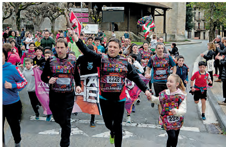
Idiazabalgo Guraso Elkarteko kideak. KORRIKA