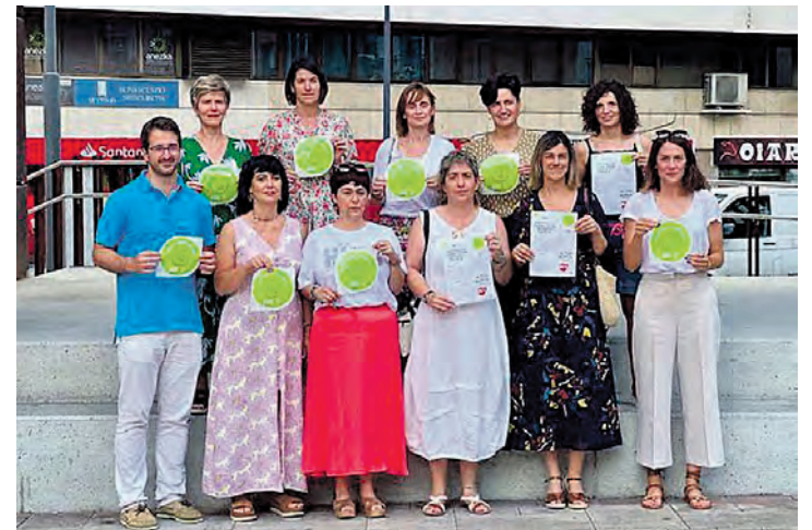
Beasaingo taldea 'Gurea erabil dezakezu' aurkezten. HITZA

Guraso talde batek bultzatuta eta Ordiziako euskaltzaleek babestuta, 1965etik ari ziren ikastola sortzeko lanean, baina bigarren saiakeran lortu zuten irekitzea, 1968an. Geroztik, metodologia ezberdinen bitartez, euskarazko irakaskuntza berritzailea ematen jardun zuen, erretiroa hartu arte. Gau Eskolan helduentzat euskara klaseak ere ematen zituzten Lasak eta Oiarbidek. ●AM