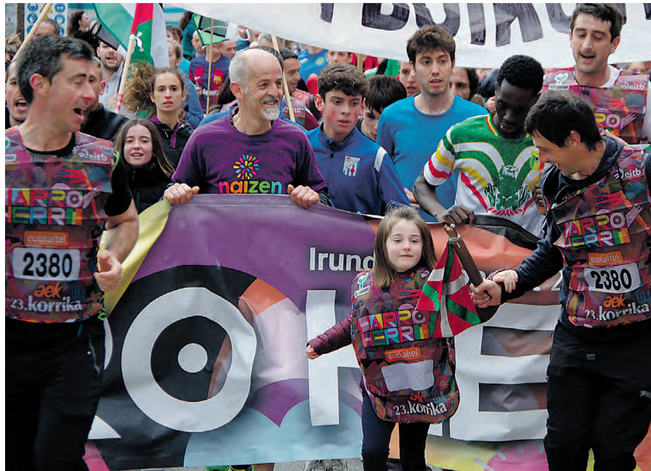
CAF enpresako LAB sindikatuko ordezkariak Beasainen korrika. KORRIKA