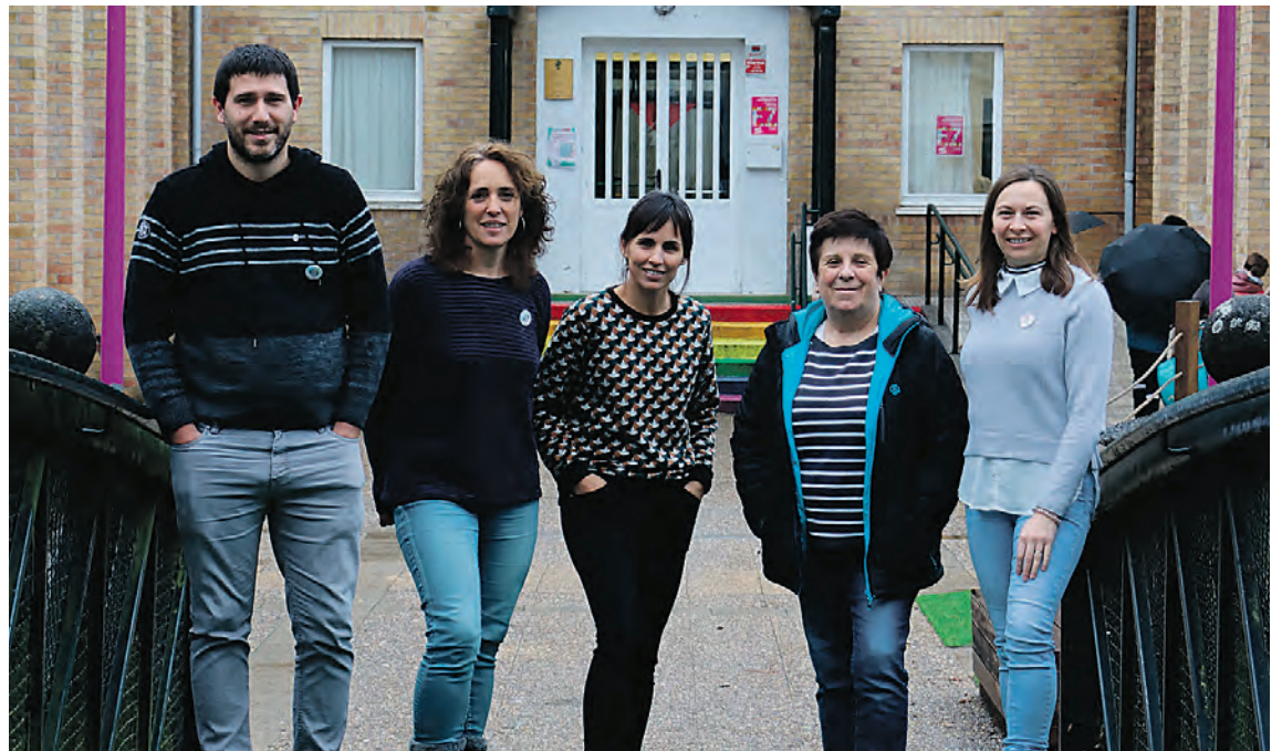
Ekimenean parte hartu duten eragileetako batzuk, Lardizabal herri eskolan. MIKEL ALBISU

Joan den ikasturtean, esaterako, beste pauso praktikoa eman zuten elkarrekin: ikasturte hasierako guraso bileren forma aldatu zuten, euskara erdigunean jarrita, familien elkarbizitza bul-