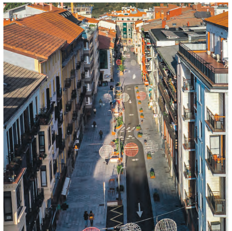
Legazpi kalea - erabateko berrikuntza. ZUMARRAGAKO UDALA

Azken urteotan garatzen ari ginen logika aurrera egiteko