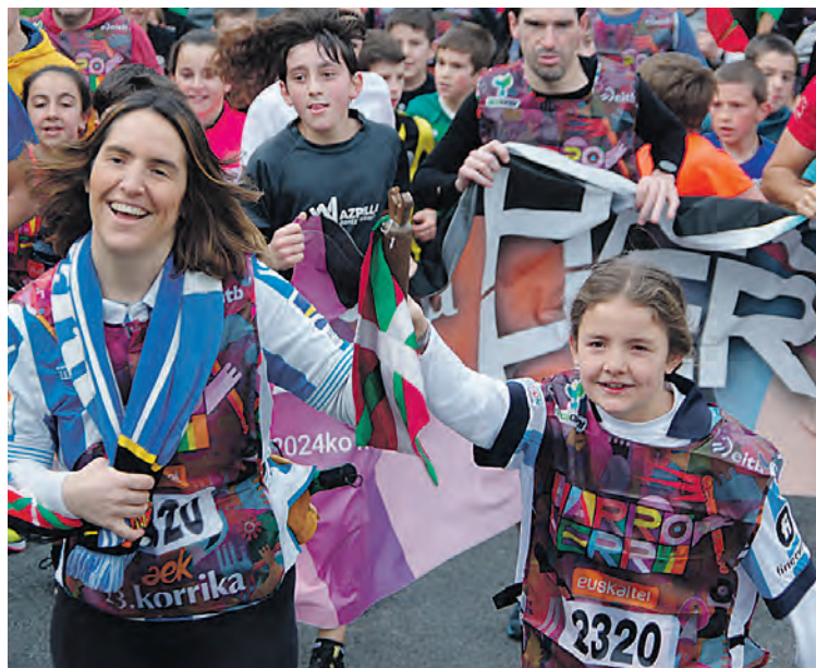
Realaren Segurako Txanbolinpe peñako kideak lekukoarekin. KORRIKA