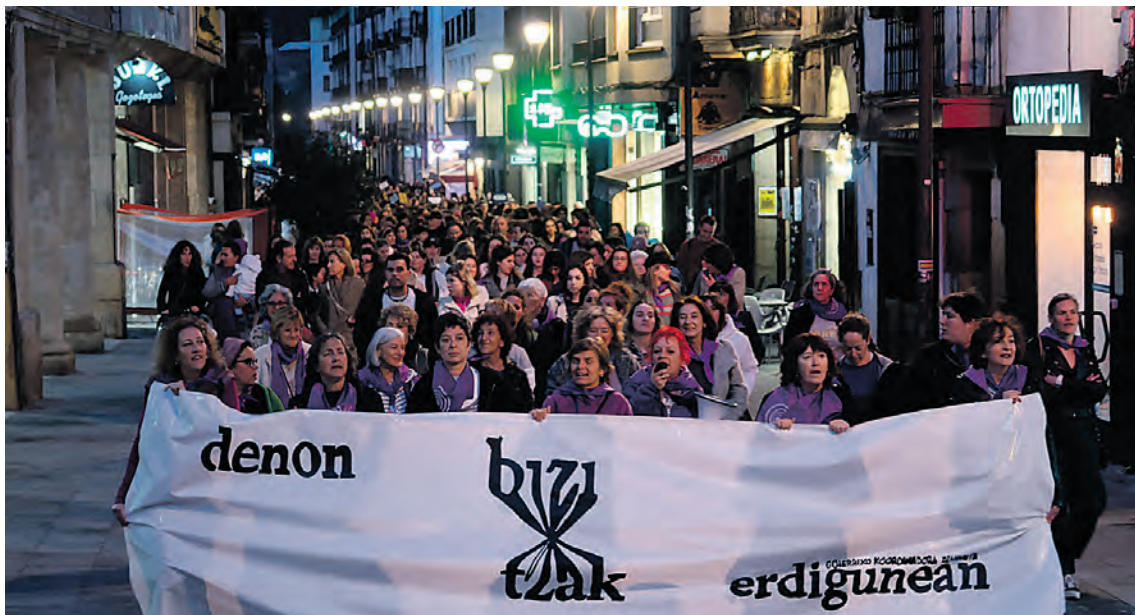
Beasaingo mobilizazio nagusia, Goierriko Koordinadora Feministak deituta. LOINAZ AGIRRE