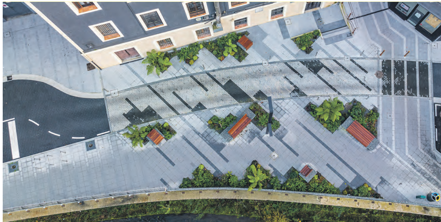
Ibaiondo kalean oinezkoentzako berreskuperatutako espazio berdea.